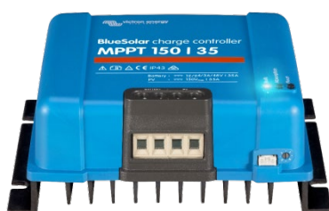
Contrôleur de charge solaire MPPT 150/35